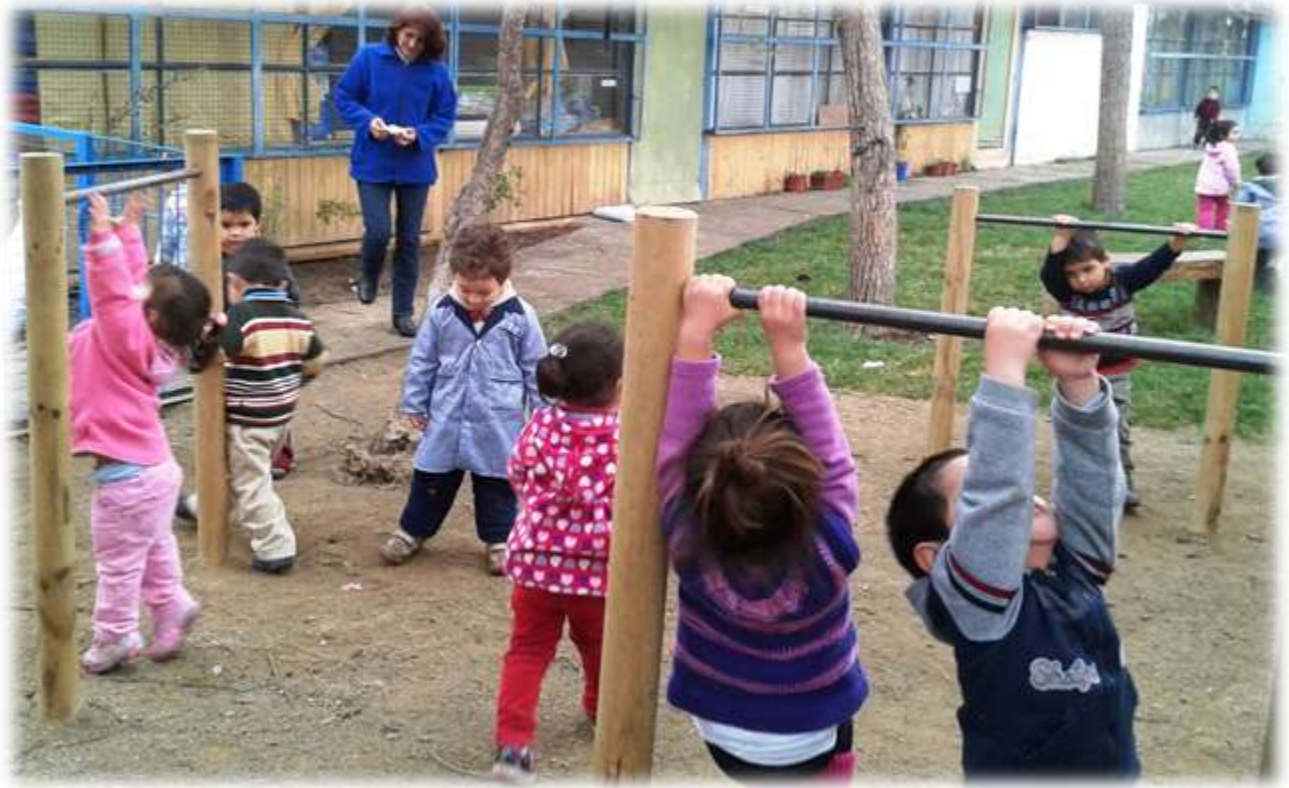
ILUSTRACIÓN N° 22: JARDÍN INFANTIL LAURITA VICUÑA, EL BOSQUE.