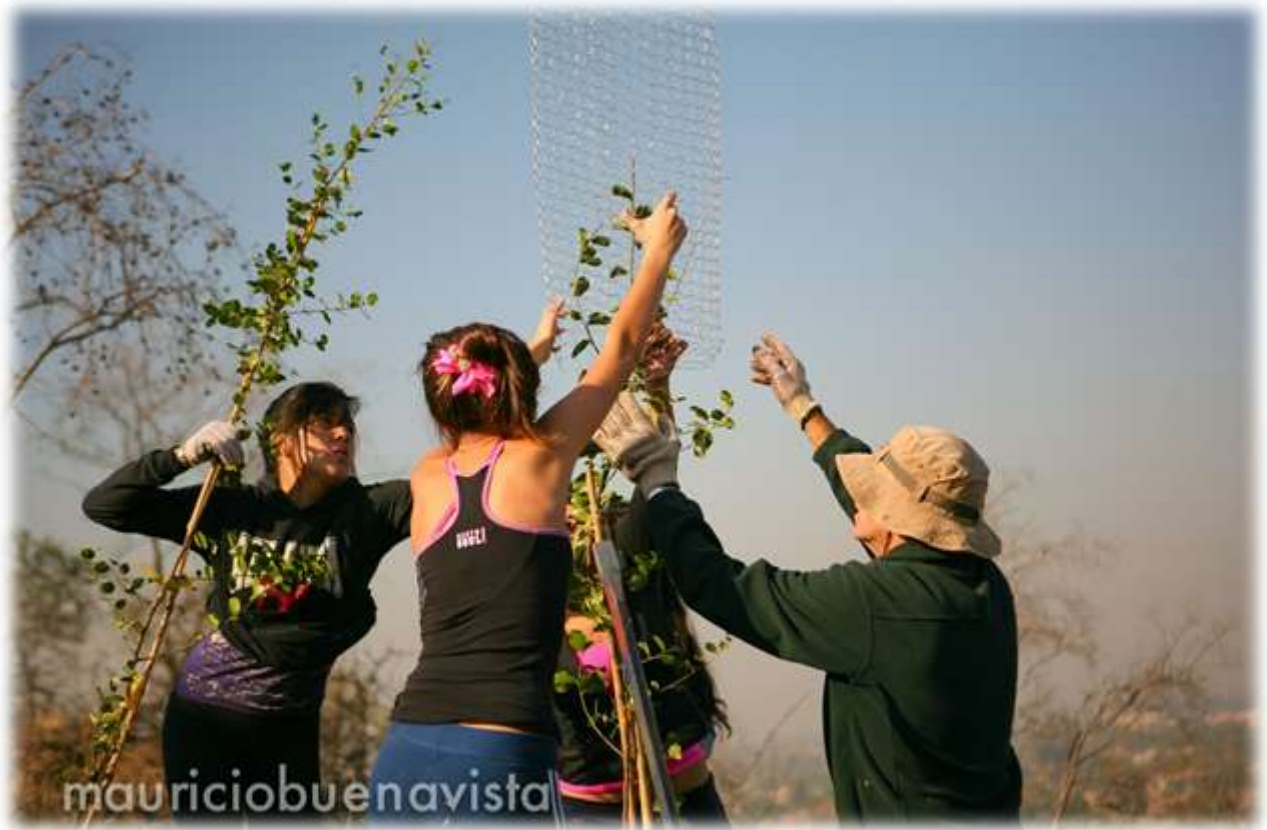
FIGURA N°11: REFORESTACIÓN CERROS DE RENCA

“Haber sido parte de un proceso de reforestación es una experiencia única, intensa, renovadora, que nos permitió conectar con: la Tierra, el Aire, el Sol, el Agua, con la Vida. Actuando la conciencia y empoderándonos de lo que significa SER humano. Desde tiempos inmemoriales, la Madre Tierra ha sido la gran generadora de vida, entregando a miles de generaciones millones de bendiciones. Pero lamentablemente hemos abusado de sus recursos, olvidándonos que al igual que todo ser vivo, merece cuidado, cariño y respeto. Cultiva a través de su anónima labor nos permite aprender, aportar y contribuir a la sanación del planeta. “Mucha gente pequeña, en lugares pequeños, haciendo pequeñas cosas, pueden cambiar el mundo” (proverbio africano). FUERZA CULTIVA! Hay un país por reforestar”.