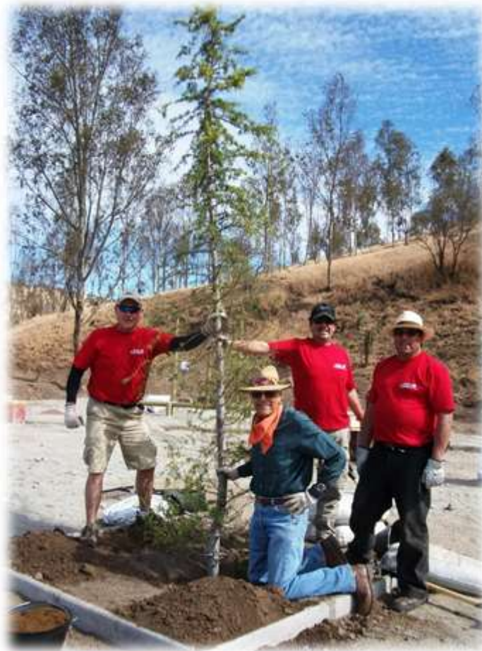
ILUSTRACIÓN N°18: CONSTRUCCIÓN PLAZA RENCA DIRECTIVOS EMPRESA FLUOR S.A.

Los proyectos se focalizan considerando diferentes criterios sociales que permitan optimizar el impacto esperado de las iniciativas, como es la localización , considerando las condiciones de acceso, entorno, cobertura de población beneficiaria y seguridad; el impacto y potencialidad del proyecto para los usuarios, su contribución a m 2 de área verde por habitante de la comuna, la visibilidad para la comunidad y para la empresa donante, y la sustentabilidad , considerando la disponibilidad de acceso a agua, cuidado y mantención tanto de los propietarios del terreno como de la comunidad beneficiada; las necesidades y participación comunitaria ; así como la existencia de otros proyectos actuales o potenciales de construcción complementaria. Estas iniciativas permiten además involucrar a la comunidad en el diseño directo de plazas, colaboración en trabajos previos para preparar los terrenos a intervenir y/o su participación en la construcción misma de las plazas y parques. Esta experiencia permite a los trabajadores de las empresas la posibilidad de interacción con los beneficiarios directos y su entorno, así como entre los propios trabajadores de las empresas.