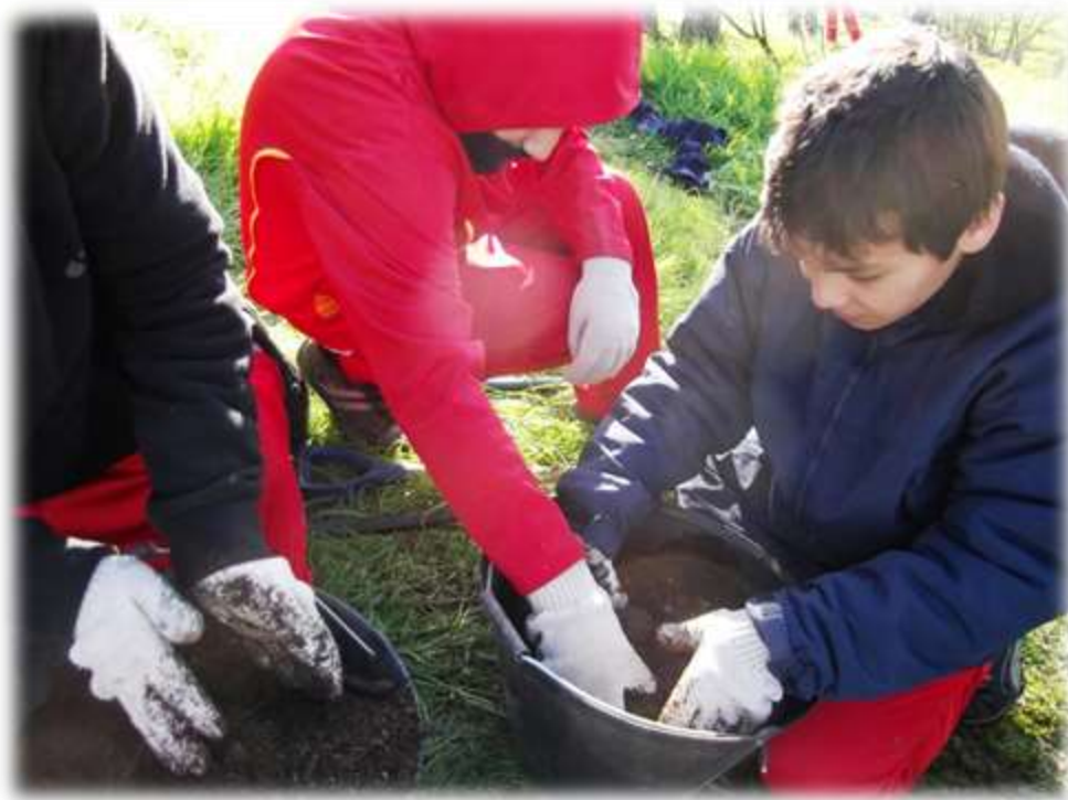
IMAGEN N° 9: REFORESTACIÓN COLEGIO MUNICIPAL GENERAL GOROSTEAGA, RENCA