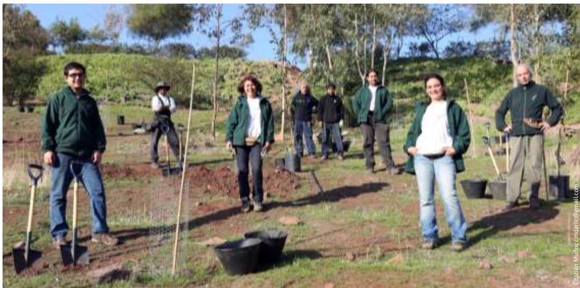
IMAGEN N°1: EQUIPO CULTIVA Y MONITORES.

En esta trayectoria de 13 años, Cultiva ha crecido como organización, ha aprendido de su experiencia, ha profundizado en sus objetivos y el sentido de su quehacer, y ha expandido sus actividades tanto geográficamente como en sus líneas de acción. Se han creado nuevos programas, llegando a nuevos segmentos y grupos objetivo, se ha ampliado la cobertura de las actividades, convocando cada año a un mayor número de voluntarios y sigue avanzando en el logro de sus resultados. Asimismo, ha ido construyendo desde el ser y el quehacer, un sello propio que le da identidad y prestigio como organización sin fines de lucro, por los cuales es reconocida ante organismos públicos y privados, que encuentran en ella un equipo comprometido con el sentido transformador y la sustentabilidad de sus actividades.