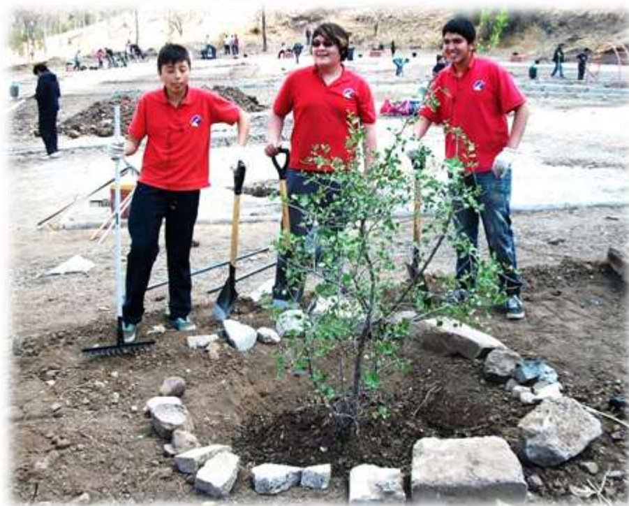
ILUSTRACIÓN N° 19: CONSTRUCCIÓN PLAZA RENCA, ESTUDIANTES DE COLEGIOS

Este proyecto fue auspiciado por el Municipio de Renca y patrocinado con la Empresa Fluor S.A. La construcción de la plaza contempló la participación de dos colegios de la comuna: Colegio Cumbres de Cóndores Poniente y Liceo Benjamín Dávila, con un total de 62 alumnos y alumnas que plantaron árboles nativos de más 2 metros de altura, principalmente de la especie Quillay, y se ocuparon de la distribución de maicillo en una amplia zona del terreno. Durante la jornada final, más de 60 trabajadores y directivos de la empresa Fluor S.A. participaron activamente en la construcción de los distintos componentes de la plaza, junto a sus familias, con la participación de un grupo de la Junta de vecinos y el Equipo Cultiva. Otros componentes de la plaza incluyen zona de trote perimetral, zonas de juegos para diferentes grupos de edades, jardineras con árboles, arbustos y plantas, nativos y ornamentales; plantación de árboles hito de gran altura, instalación de zonas de descanso, instalación de zonas de pasto natural, distribución de maicillo, entre otros.