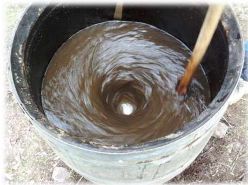
Figura N° 6: Preparado biodinámica.

También durante este año se inició un proceso de ampliación de los sistemas de riego y mejoramiento de todos los puntos de provisión de agua en los cerros reforestados, a través de la instalación de nuevos estanques y redes de distribución de agua, el reemplazo de llaves de agua por bastones de regadío, con el fin de evitar la