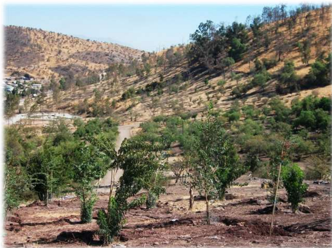
FIGURA N° 7: REFORESTACIÓN PARQUE CERROS DE RENCA.