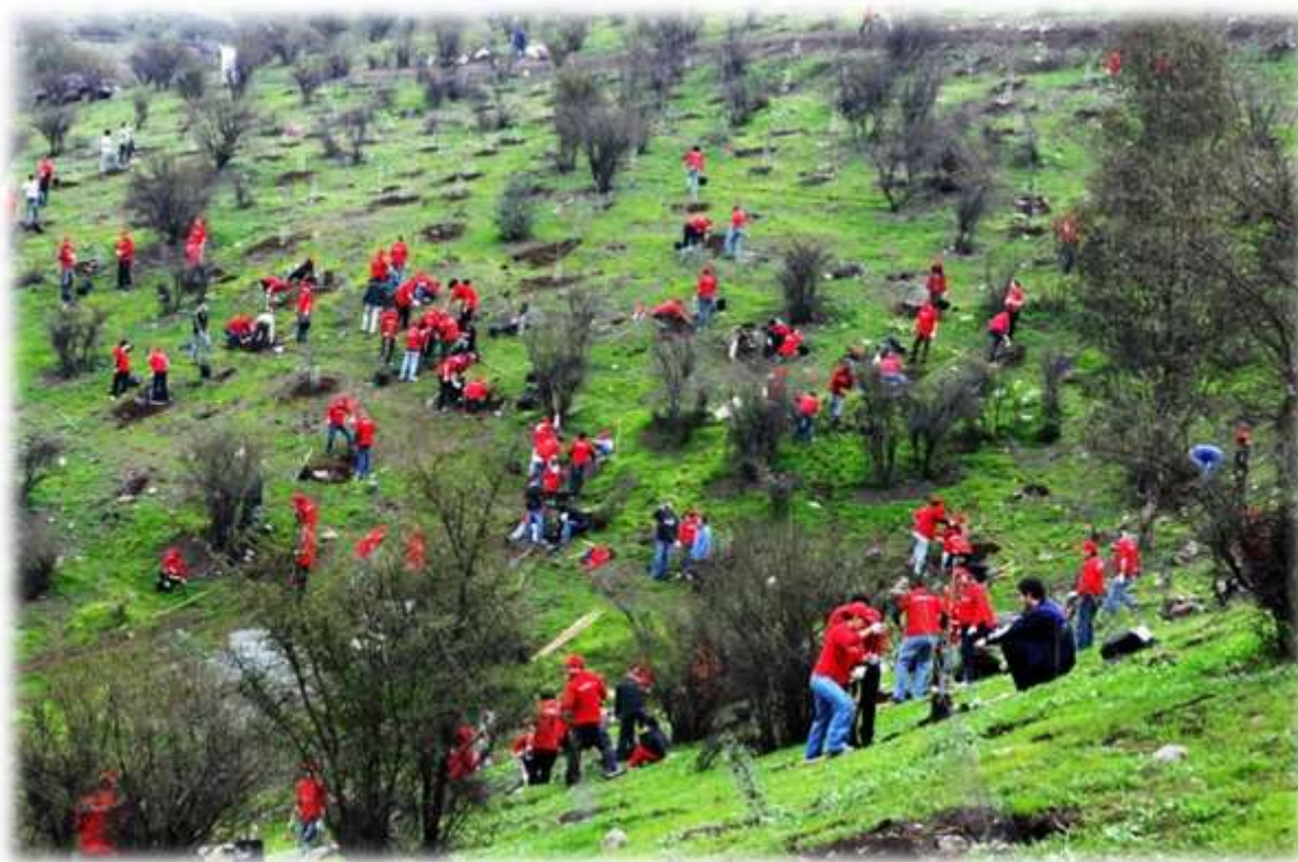
FIGURA N° 13: REFORESTACIÓN SCOTIABANK

El Santuario también ha sido beneficiado por el plan de consolidación del bosque, a través de la mantención de las zonas reforestadas, donde los árboles deteriorados (quebrados o arrancados) por factores externos (basura, tránsito de personas, animales y otros) han sido reemplazados, densificando las áreas verdes para aumentar la aceptación y valoración por parte de la comunidad.