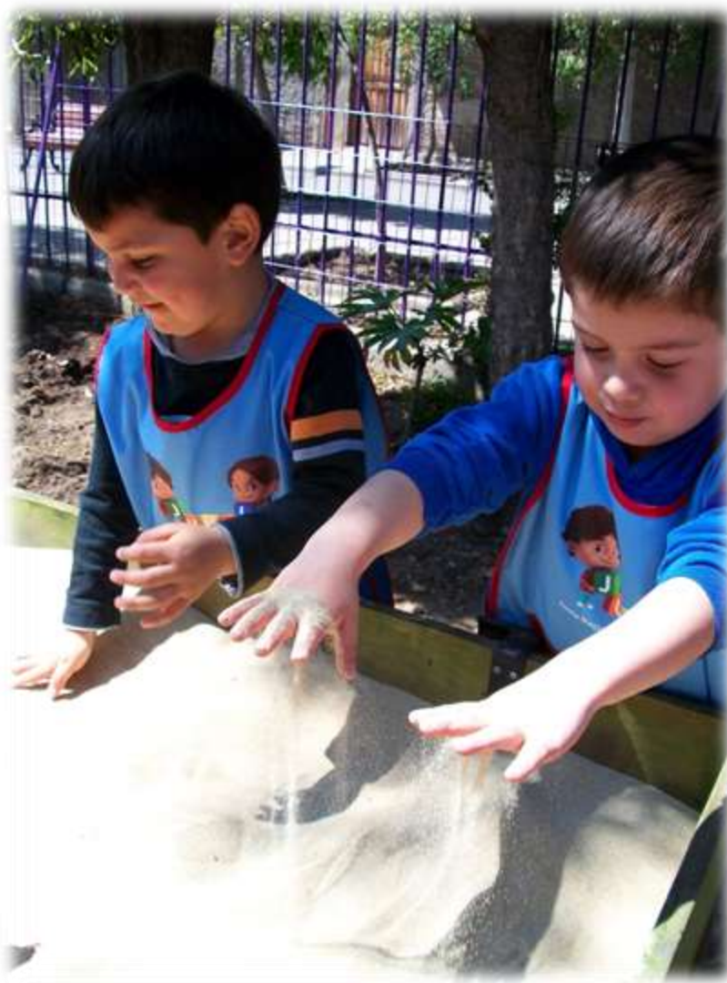
FIGURA N° 25: JARDÍN INFANTIL "PEQUEÑO POEMA", LA GRANJA