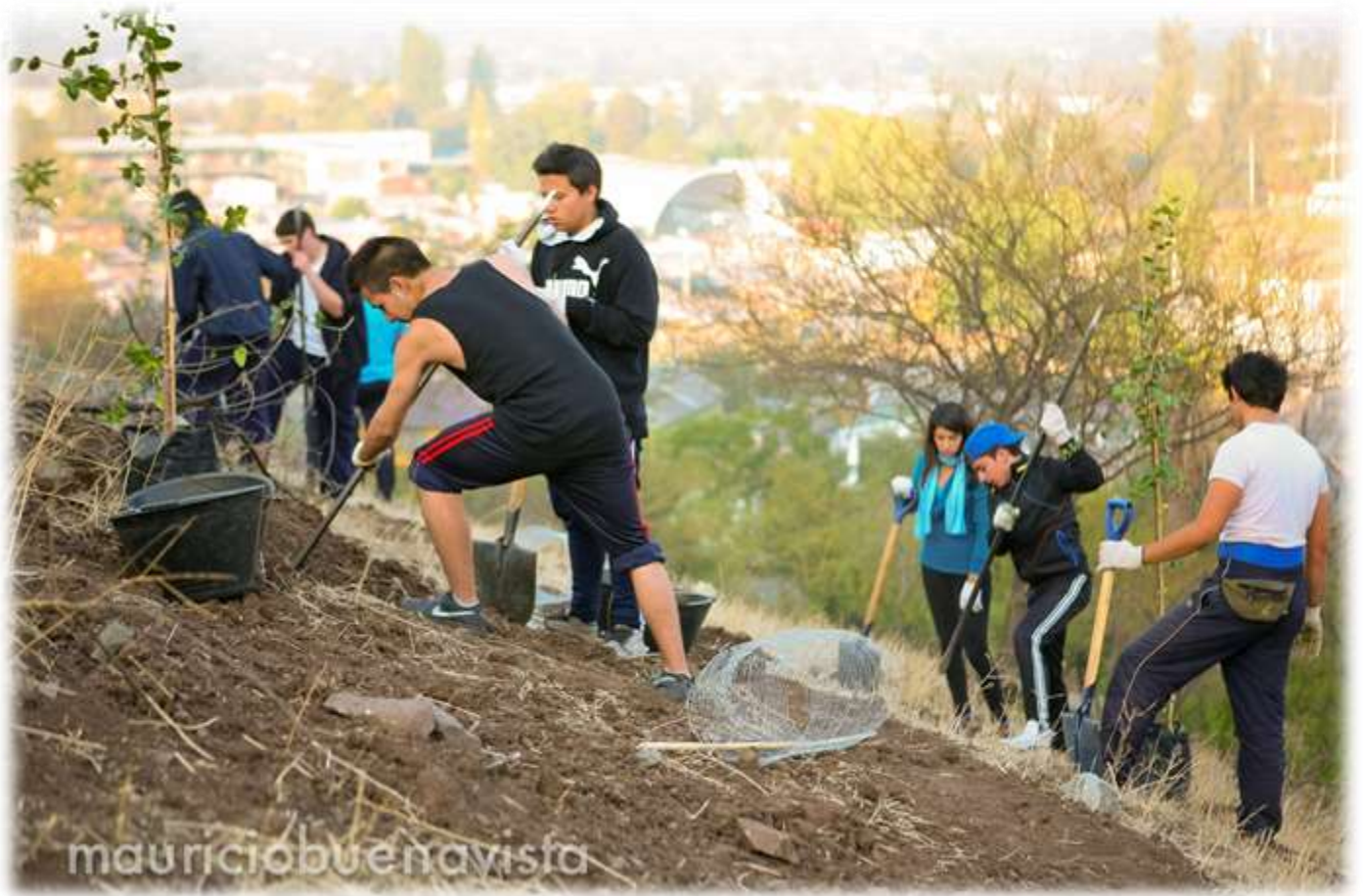
IMAGEN N° 10: REFORESTACIÓN PARQUE CERROS DE RENCA