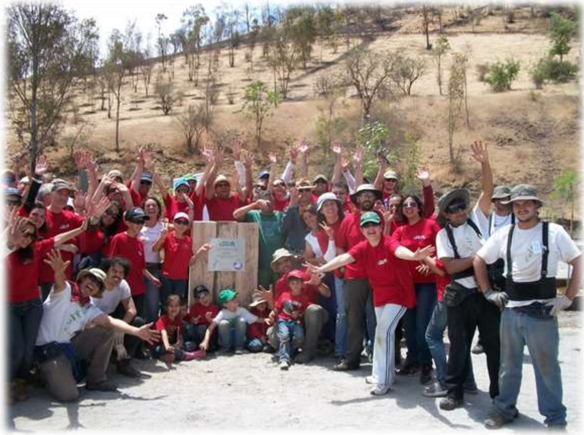
ILUSTRACIÓN N° 21: CONSTRUCCIÓN DE PLAZA RENCA, VOLUNTARIOS.

“Trabajar con Cultiva fue una experiencia para cada uno de los miembros de nuestra oficina y sus familias, permitiéndonos fortalecer nuestros lazos como parte de una mismo equipo, conocernos más allá de lo meramente laboral y ayudar directamente a la comunidad de un proyecto de gran relevancia social”