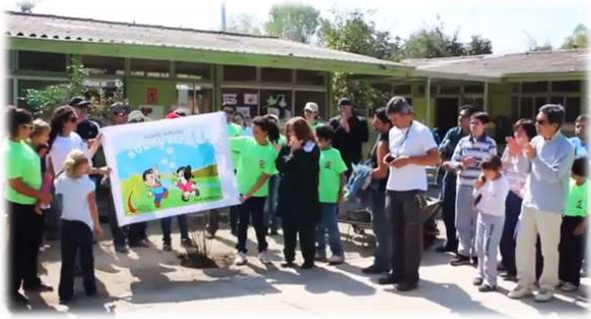
FIGURA 23: JARDÍN INFANTIL “BURBUJITAS”, CERROS NAVIA.

“Bechtel quiere dejar un legado de sustentabilidad a través de las diferentes actividades de voluntariado corporativo en que participan nuestros colaboradores. El trabajo de revitalización y mejoramiento dos jardines infantiles junto a Cultiva es un ejemplo de esto”