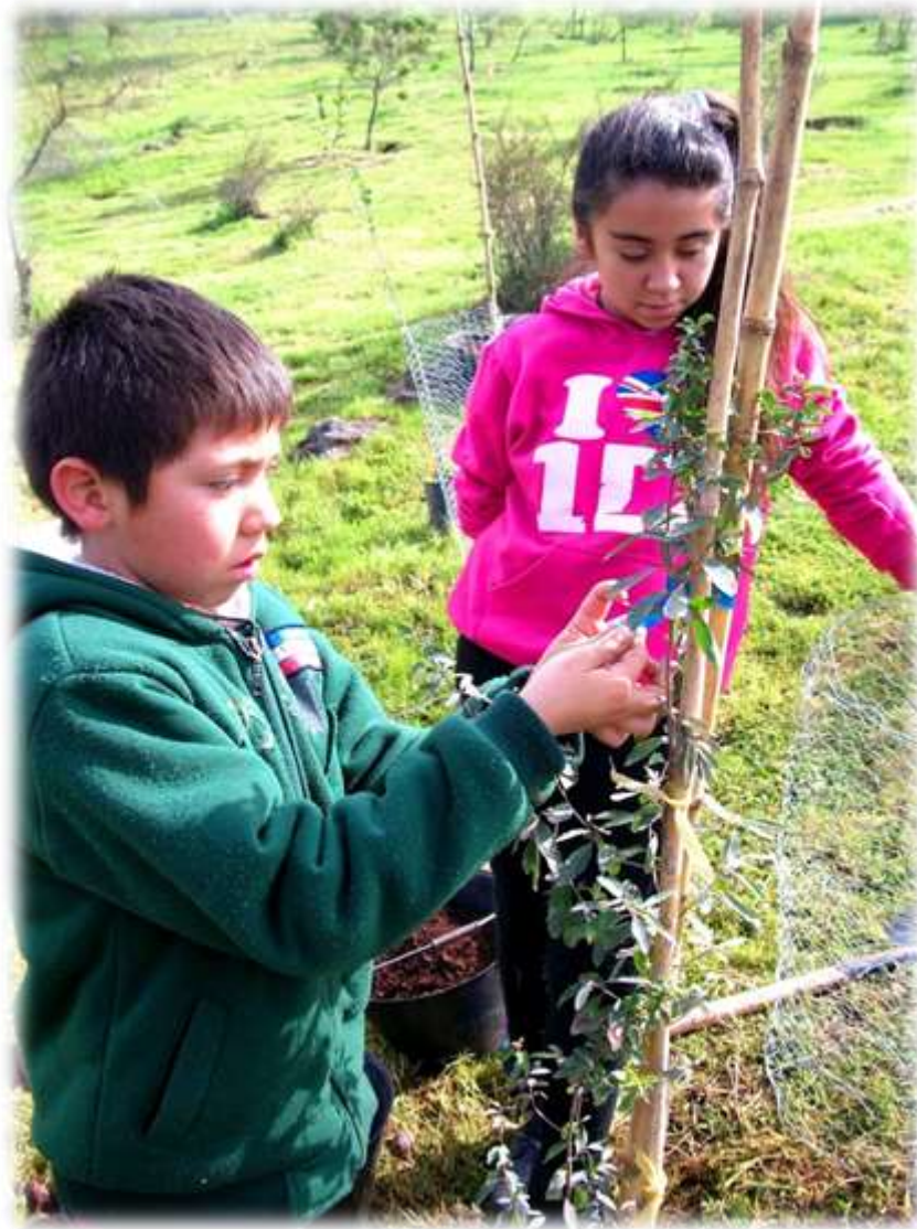
IMAGEN N° 12: REFORESTACIÓN PATRULLA ECOLÓGICA DE BATUCO.