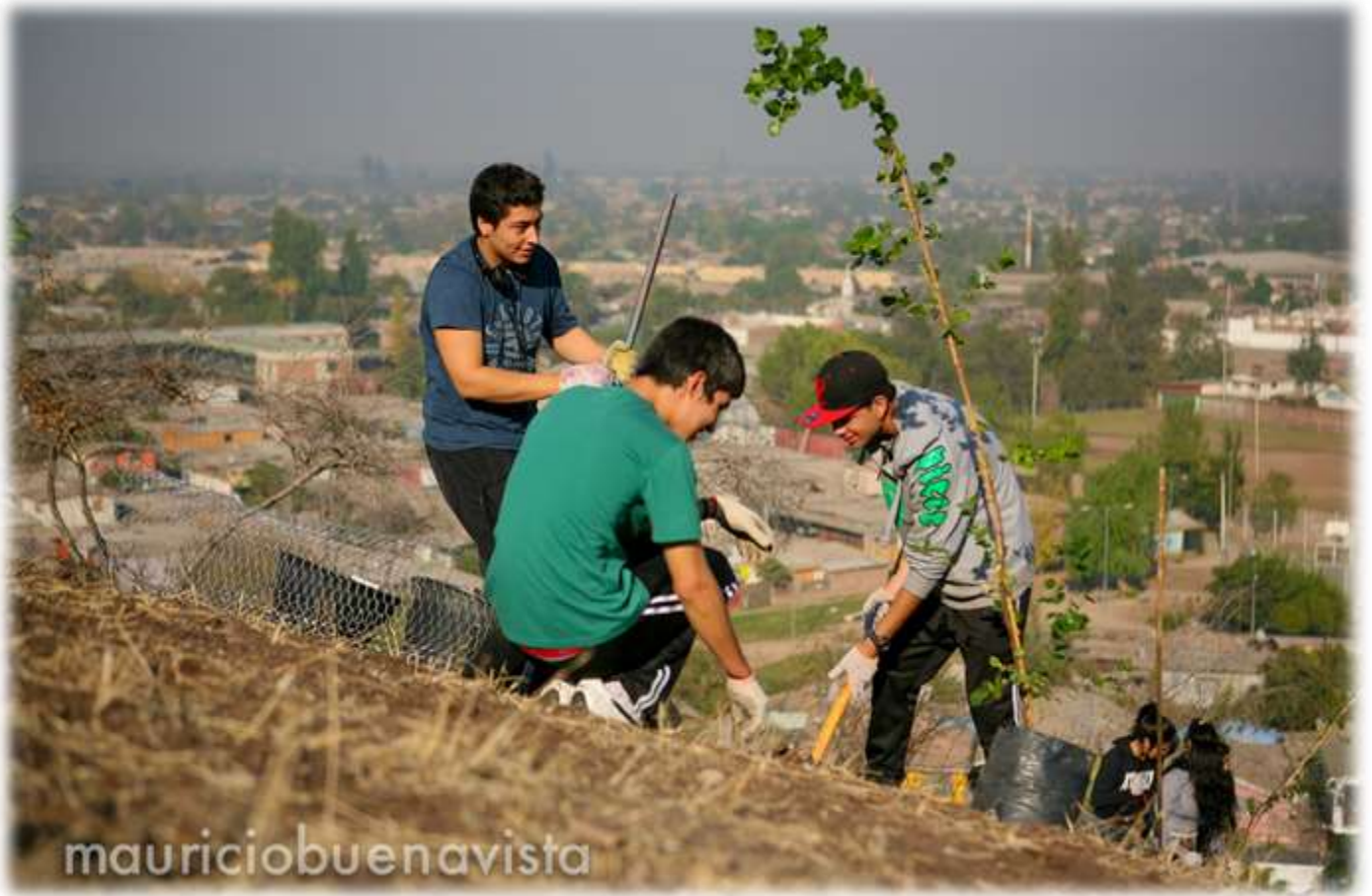
FIGURA N°2: JORNADA DE REFORESTACIÓN, COLEGIO CUMBRES DE CÓNDORES PONIENTE.