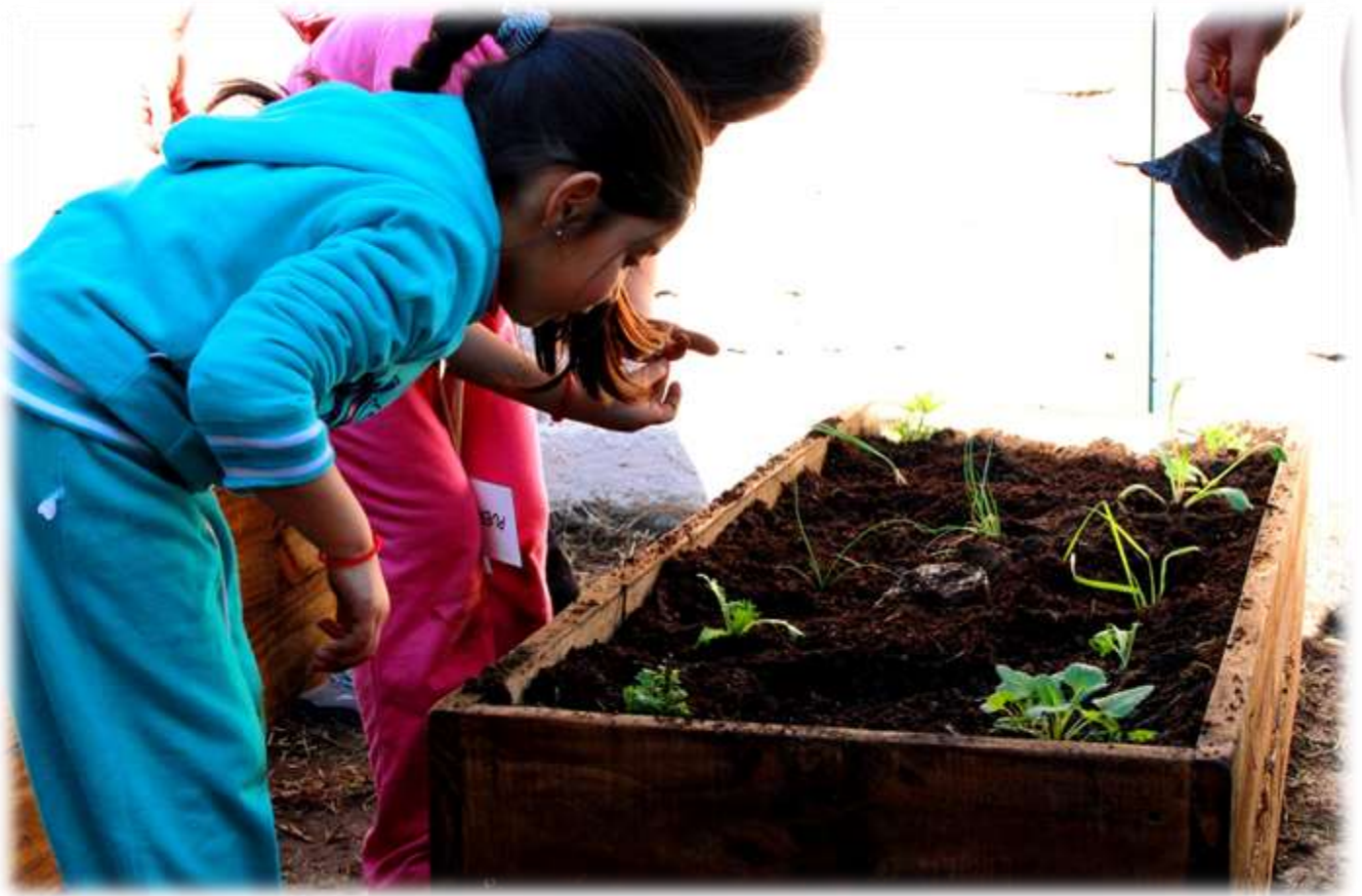
IMAGEN N° 4: JORNADA DE TRABAJO, ÁREAS VERDES EN JARDÍN INFANTIL LAURITA VICUÑA, NIÑAS RECONOCIENDO LAS ESPECIES PLANTADAS EN EL HUERTO