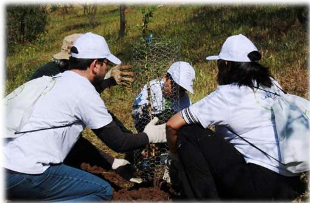
FIGURA N° 16: REFORESTACIÓN LAN CHILE