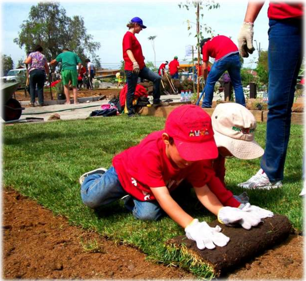
FIGURA N° 17: CONSTRUCCIÓN DE PLAZA CERROS DE RENCA, FLUOR Y COMUNIDAD DE RENCA.