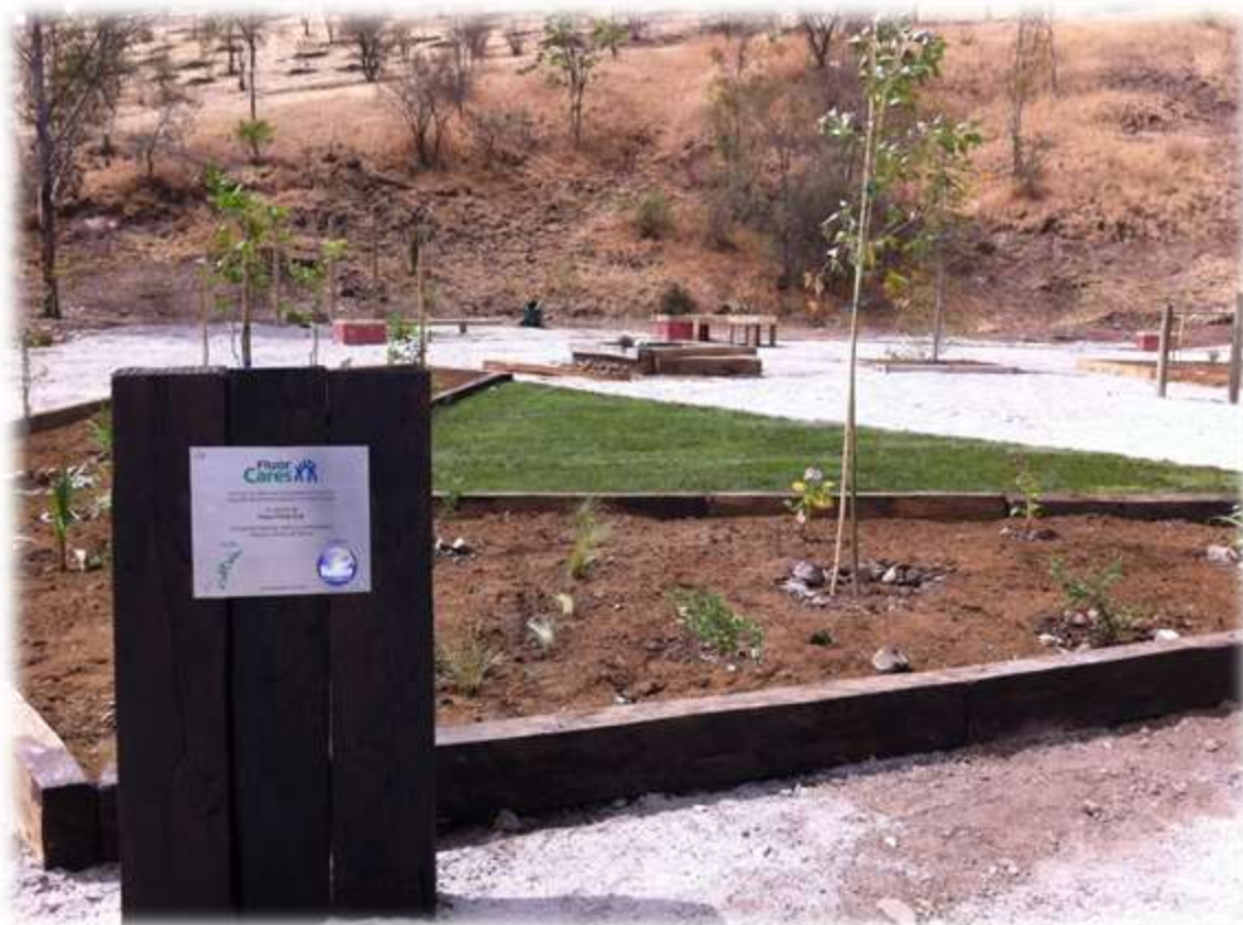
ILUSTRACIÓN N° 20: CONSTRUCCIÓN DE PLAZA RENCA, PLACA CONMEMORATIVA.

Al término de la jornada se realizó un significativo evento de inauguración de la Plaza con todos los participantes, al que asistieron representantes del Municipio de Renca y del Departamento de Aseo y Ornato del Municipio de Renca. En la ocasión se entregó una placa recordatoria de los auspiciadores y patrocinadores del proyecto.