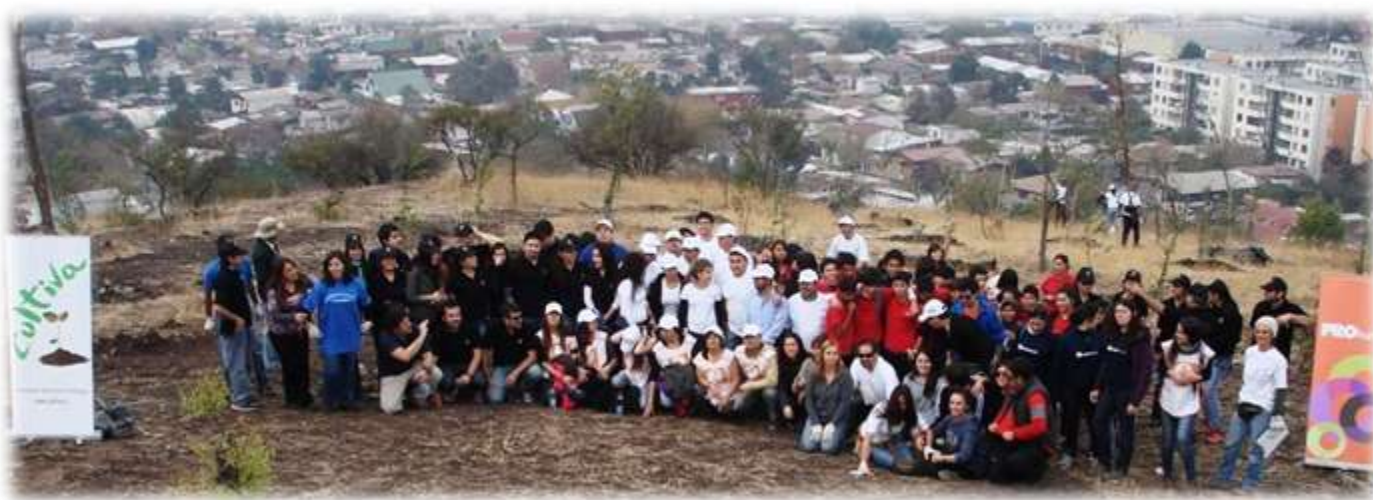
IMAGEN N° 8: REFORESTACIÓN GERDAU, RED PRO-HUMANA Y COLEGIO CUMBRES DE CÓNDORES

Asimismo, aportar a las numerosas comunidades residenciales aledañas a los terrenos, a contar con un mejor entorno que mejore su calidad de vida, en salud y convivencia. El aumento progresivo de nuevos árboles nativos en los cerros y el involucramiento de las comunidades en las actividades de reforestación en los últimos años, van generando mayor conciencia y un efecto demostrativo de valoración y cuidado de los mismos en los vecinos y en quienes visitan estos lugares abiertos al público.